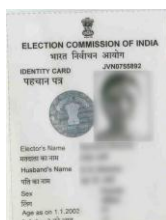
मतदाता पहचान पत्र फोटोग्राफ